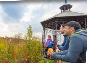
Giengen mit seiner markanten Stadtkirche ist der Start- und Endpunkt des Albschäferwegs.